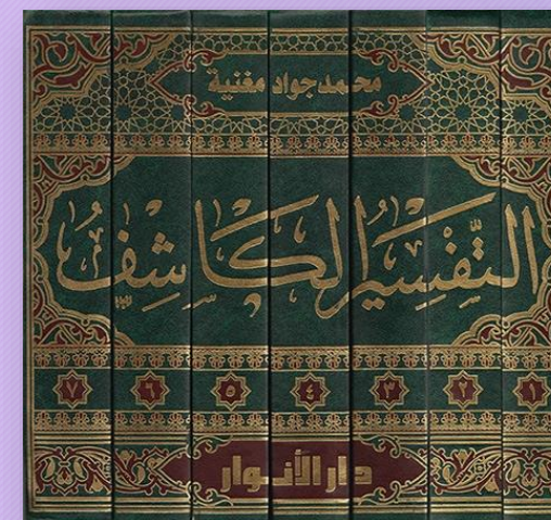
Tafssir al-Kashif, vol.3, p.73